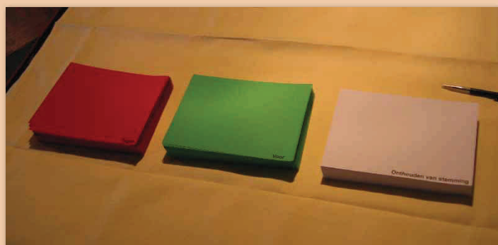
De uitgewerkte voorstellen komen bij de ALV in stemming.

Bij de totstandkoming van het Plan van Aanpak en nu bij de uitvoering van onderdelen uit het Plan van Aanpak is er volop inbreng vanuit de aangesloten rasverenigingen. Via de aangesloten rasverenigingen hebben ook de daarbij aangesloten fokkers, fokadviescommissies en andere belanghebbenden een stem in de uitvoering van onderdelen van het Plan van Aanpak. De Raad van Beheer hecht veel waarde aan deze inbreng, we zijn immers een vereniging van verenigingen. Via diverse bijeenkomsten is er door de rasverenigingen via de 'Werkgroep Fokkerij & Gezondheid' en de 'Taskforce Rasverenigingen' veel werk verricht. Tijdens de afgelopen Verdiepingsdagen zijn er belangrijke stappen gezet in de uitvoering en is er inzicht gegeven in de noodzaak hiervoor. Hierdoor is er draagvlak gecreëerd voor deze belangrijke stappen in het fokbeleid.