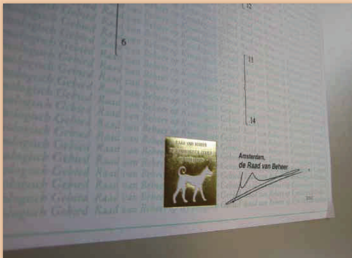
Stamboom: niet alleen afstamming, maar ook inzicht in kwaliteit door normen-matrix

Een voorstel tot besluitvorming wordt nu voorbereid en de leden besluiten hierover in 2012.