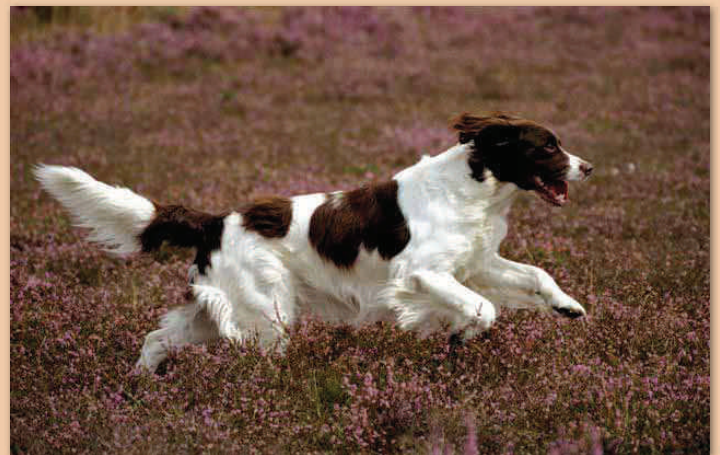
De rasstandaard van de Nederlandse rassen krijgt extra aandacht.

Dit project is gestart met drie rassen te weten Saarlooswolfhond, Dashond en Golden Retriever. Er is een klankbordgroep met vertegenwoordigers uit alle belangrijke externe partijen inclusief de rasverenigingen van de drie betrokken rassen. De eerste bijeenkomst van de klankbordgroep heeft inmiddels plaatsgevonden.